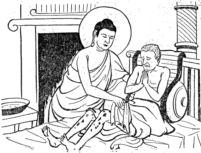
大慈大悲，救苦救難的 佛陀親自照料病比丘。

這一事業，大家 的意思，只歡迎各大 善士的樂捐，而不出 捐冊向外去募，只在 菩提樹上發表消息， 使大家知道，可以隨 力種德收福，不致有 好事向隅之歎。奉勸 諸位發菩提心的，早 來幫助，有恩欲報的 ，早來幫助，求種福 田的，早來幫助，想 做功德的，早來幫助 ，為佛教增光的，早 來幫助。